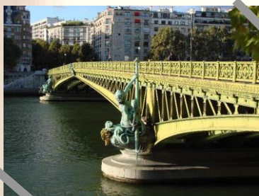
Le pont Mirabeau Guillaume Apollinaire